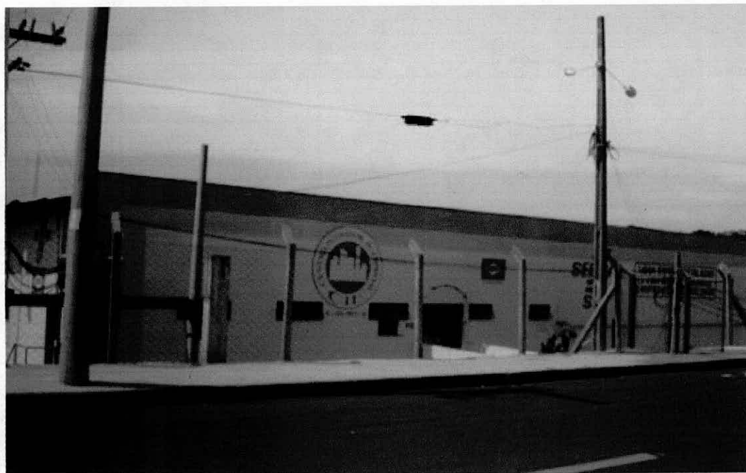
Incubadora de empresas de São José do Rio Preto