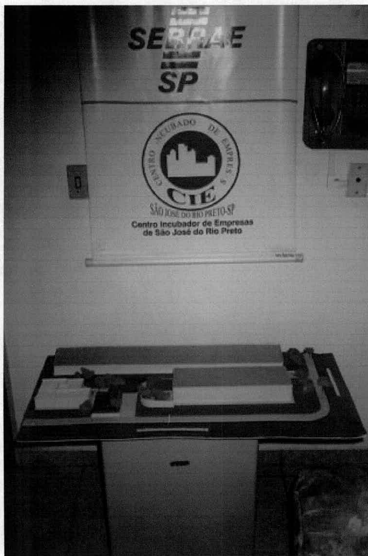
Maquete do novo prédio da Incubadora