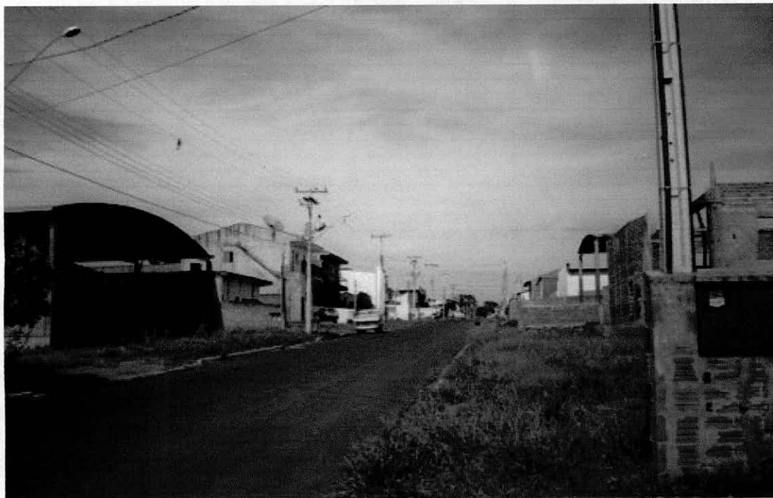
Foto do Minidistrito Centenário da Emancipação