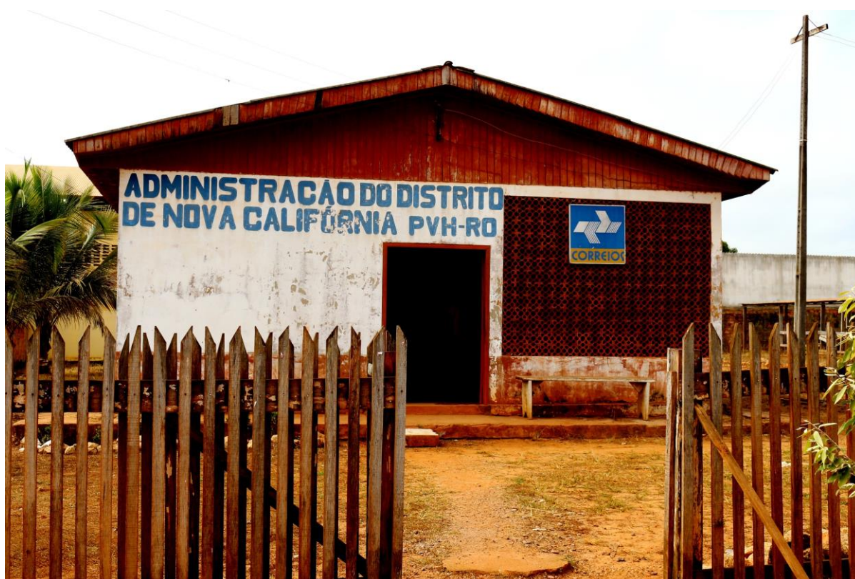
2. Sede da Administração Local do distrito