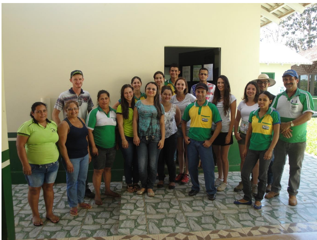
5. Equipe do Reca e pesquisadoras do Conexão Local