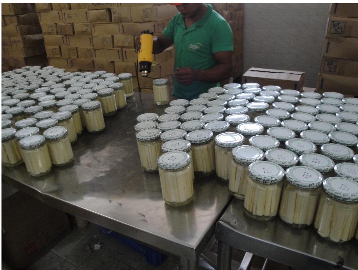
3. Unidade de beneficiamento de palmito de pupunha