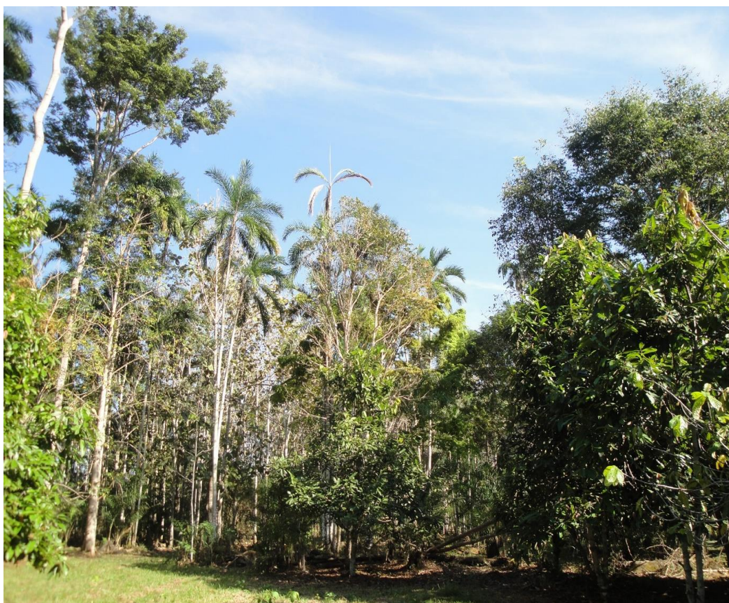
4. Propriedade e plantação de Semildo