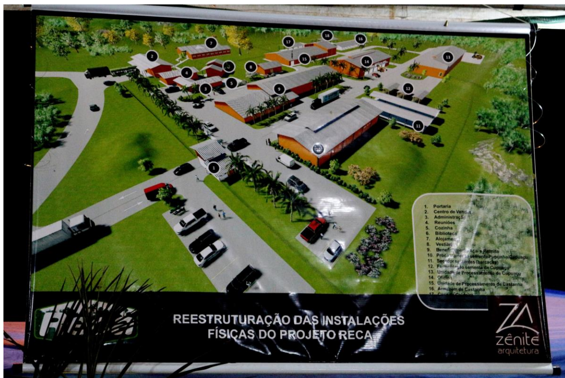
1. Projeto de ampliação e modernização das estruturas do Reça