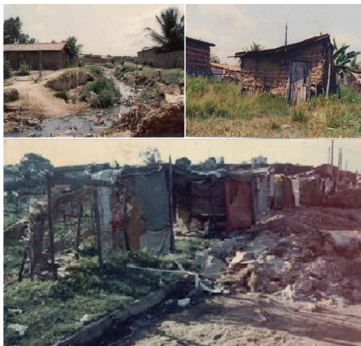
Figura 1. Conjunto Palmeira na década de 70.

A decisão, além de imediata, precisava ser definitiva!