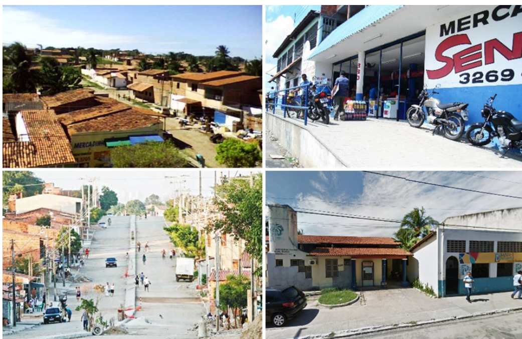
Figura 3. Conjunto Palmeira entre 2013 e 2015.