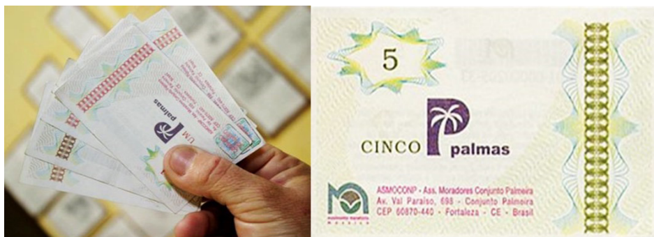
Figura 2. Moeda Palmas.