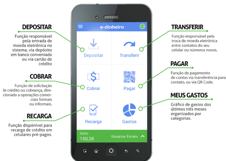
Figura 4. Plataforma E-Dinheiro e funções do aplicativo para smartphones.