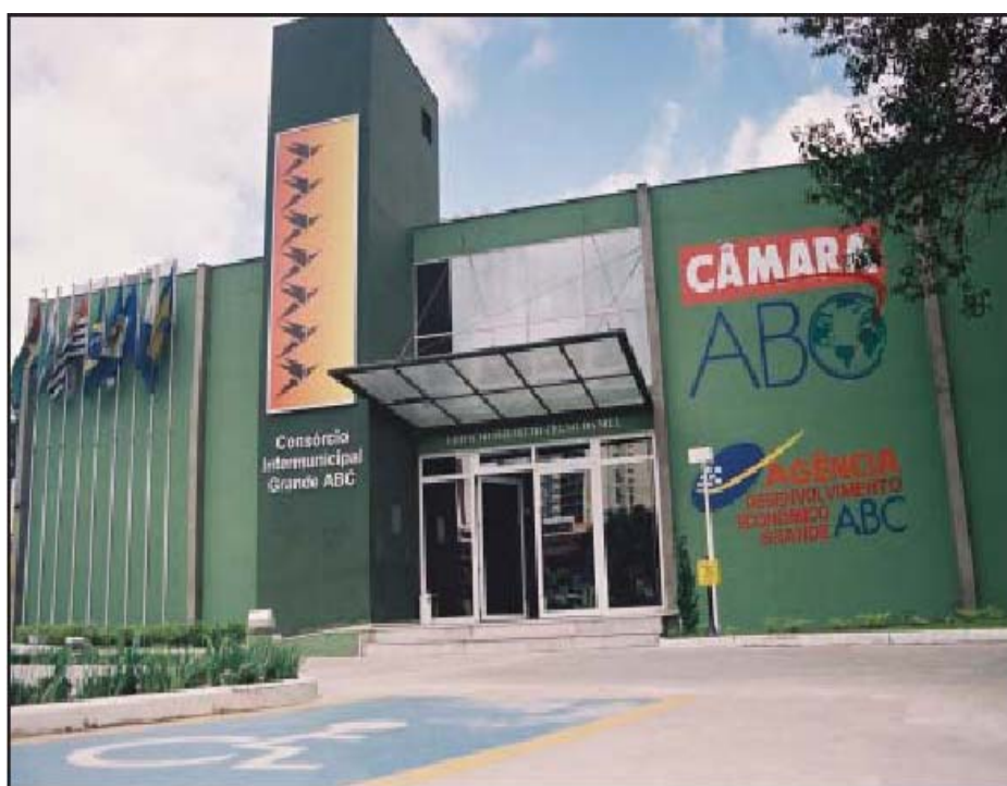
FIGURA 2 – Câmara Regional do Grande ABC

A Câmara Regional tinha, e ainda tem, por finalidade formular, apoiar, acompanhar e mensurar ações para o desenvolvimento sustentável do Grande ABC e, de certa forma, representa um fórum democrático englobando o poder público e a sociedade civil.